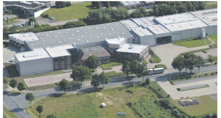
Firmenzentrale Wesemann Laboreinrichtung in Syke bei Bremen