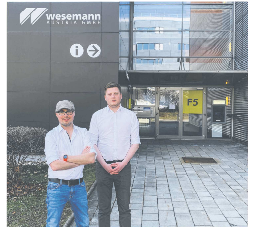
Wesemann Austria GmbH am neugegründeten Standort in Wien

Das Firmenjubiläum soll am 01.10.2021 mit einem großen Fest mit Mitarbeitern und Geschäftspartnern gefeiert werden, sofern die Corona-Situation dies erlaubt.